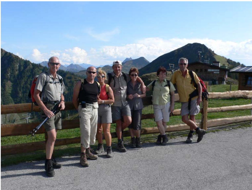
Die Aktiven - noch vor der Anstrengung!